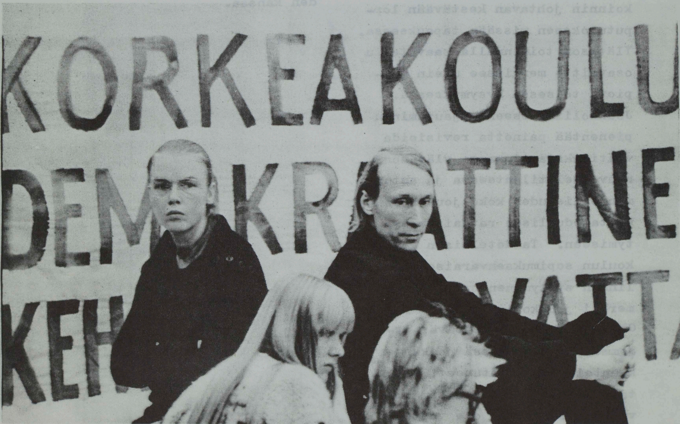
Tämä kuva on vuodelta -75, vielä silloin Budjetti kamppailu oli kova ja yhtenäinen, valitettavasti jotkut ihmiset muuttuvat vaikka taistelu jatkuu (huom. kukkis mukana. toimituksen huom.)

Myös TAOS:n, kuten kaikkien muidenkin marxilais-leniniläisten järjestöjen periaate poikkeaa muista poliittisista järjestöistä hyvin paljon, jos tarkastellaan sen suhdetta joukkoliikkeeseen. Meille on tärkeää, että oman jäsenistömme lisäksi myös muut samassa tilanteessa olevat opiskelijat ovat selvillä meidän toimintalinjastamme, siitä kuinka me perustelemme oman kantamme. Me teemme oman näkemyksemme julkiseksi jopa siinäkin tapauksessa, että saisimme läpi joitakin tavoitteita